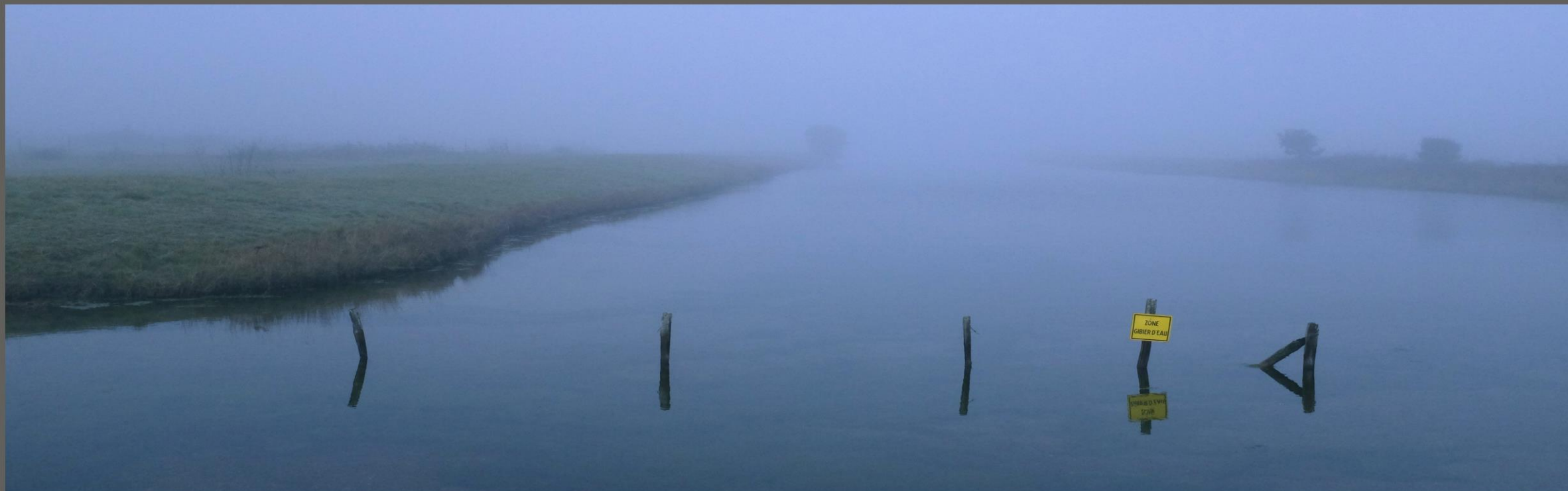
Matin brumeux - marais de Saugelle