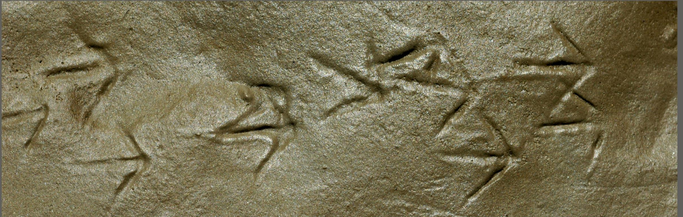
Traces - Marais de Saunzelle