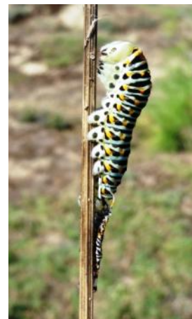
Photo de droite : chenille venant de muer (on distingue l'ancienne peau)

Très vorace la chenille dévore des feuilles toute la journée, multipliant son poids par 1000. Au fil des mues, la couleur verte s'étend tandis que la tâche blanche et les picots s'estompent.